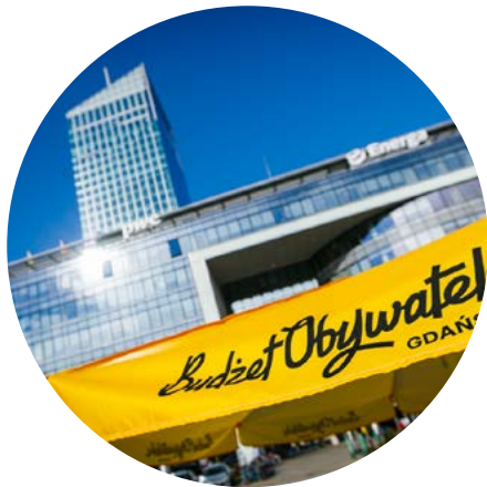
Budżet Obywatelski Gdańsk 2022

Razem z Wami braliśmy udział w licznych akcjach i projektach wspierających naszych oliwskich Sąsiadów i Miasto Gdańsk. Wśród nich były: