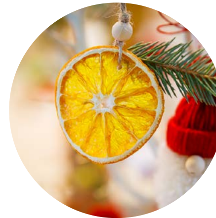
Charytatywny Kiermasz Świąteczny w Olivii Star