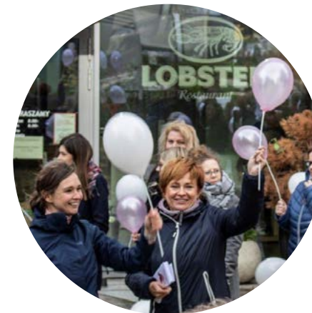
#Pinktober projekt wolontariuszy firmy Energa