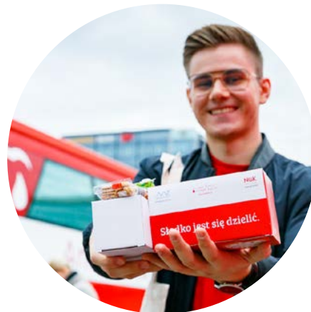
Kropelka Energii wspólnie zebraliśmy ponad 150 litrów krwi